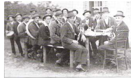
Die Wenigzeller Musik um 1930 (Foto im Besitz von H. Tiefengraber).